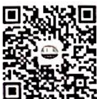
电力标准信息微信