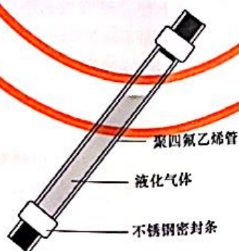
图 1 典型的渗透管结构图

5.2 氟化氢渗透管。封装有纯的液化氟化氢的聚四氟乙烯管，渗透管应提供不同温度条件下的气体渗透率( P_t )并在有效期内使用，渗透管的渗透率测量方法见附录 A。当渗透管中液体液位低于管长的 1/10 时应更换，如果渗透管渗透率的变化大于 10%，也应更换渗透管。典型的渗透管结构图见图 1。