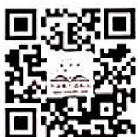
中国电力百科网网址