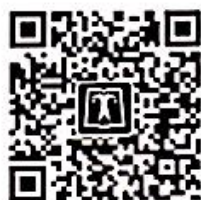
中国电力出版社官方微信